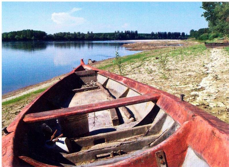
Uno scorcio del corso emiliano del Po nei dintorni di Guastalla.