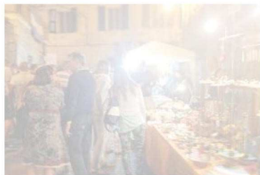
Mercatini e animazione nelle piazzette