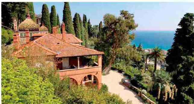
Sopra i giardini di Villa della Pergola ad Alassio; sotto Belli Fulminati nel Bosco, oggi a Chiusanico