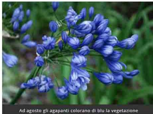
Ad agosto gli agapanti colorano di blu la vegetazione

È l'occasione per una passeggiata rigenerante. Immersi nella natura in uno dei rari esempi di giardino inglese in Italia, per chi si trova in vacanza sulla Riviera o vuole fare una gita fuoriporta in giornata a Ferragosto o nel weekend: i giardini sono aperti per visite guidate su prenotazione tutti i weekend e, in via straordinaria, anche il giorno di Ferragosto (per informazioni ).