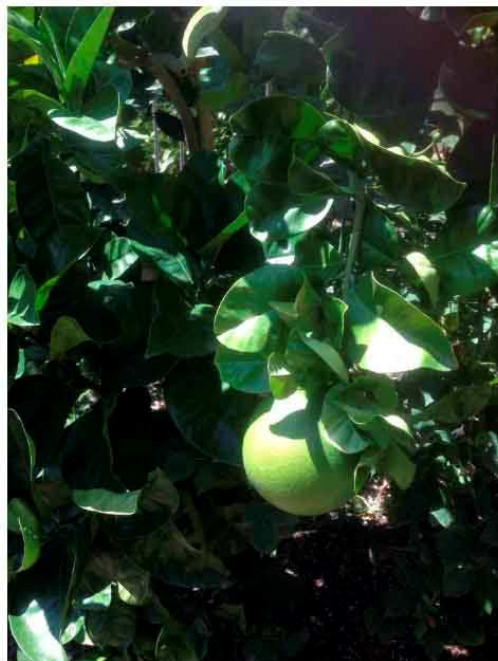
Citrus grandis o Pomelo

Lungo le terrazze dei giardini si trovano, tra gli altri, il Citrus x aurantium Salicifolia, l'arancio amaro a foglie di salice, il chinotto Citrus myrtifolia , il limone cedrato Citrus limonimediterranea Pigmentata, con fiori molto profumati e frutti grandi e Murraya paniculata , con fiori bianchi, frutti piccoli e foglie aromatizzate utilizzate nel curry.