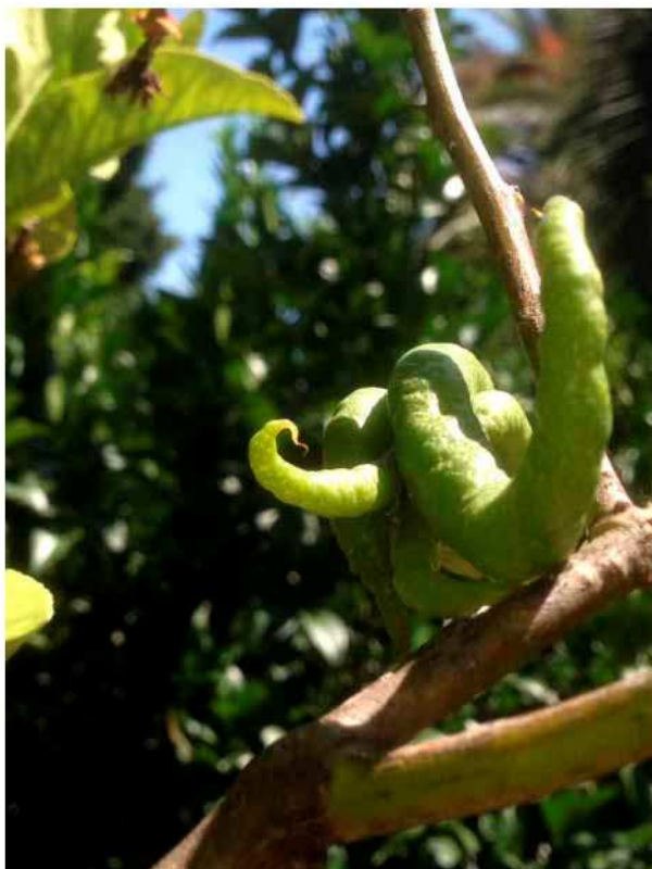
Citrus medica digitata o Mano di Buddha

http://www.giardinidivilladellapergola.com - http://www.villadellapergola.com